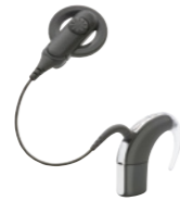
Procesorul de sunet Nucleus 5