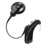
Procesorul de sunet Nucleus 6