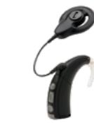
Procesorul de sunet Nucleus® Freedom®