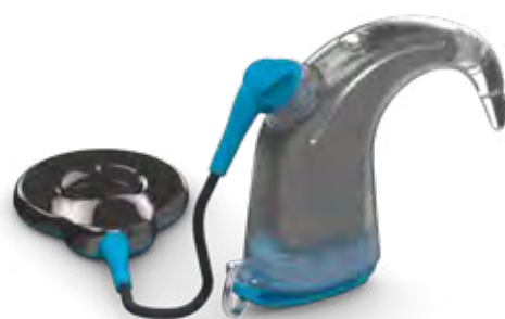
Aqua+ für den Nucleus 8 Soundprozessor

Mit einem neuen Soundprozessor müssen Sie sich keine Sorgen machen, wenn Sie einmal in einen Regenguss geraten. Nucleus Soundprozessoren sind spritzwasserbeständig und staubdicht und bieten die höchste verfügbare Wasserbeständigkeit (IP68) für Soundprozessoren. Verwenden Sie Aqua+, um Ihren Soundprozessor bei Ihren Lieblingsaktivitäten im Wasser zu schützen.**,*