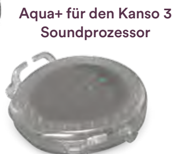
Aqua+ für den Kanso 3 Soundprozessor